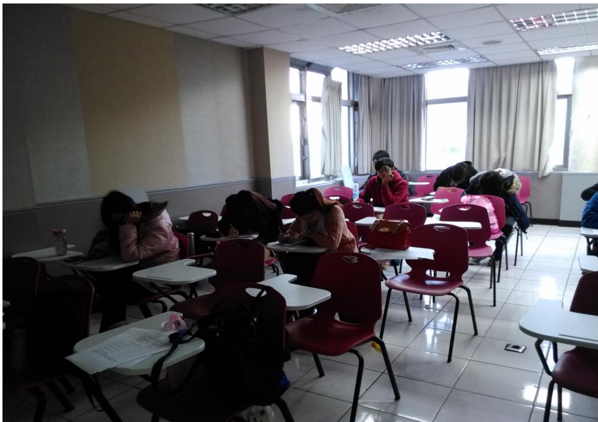
照片 4：同學們認真地思考老師所提的問題