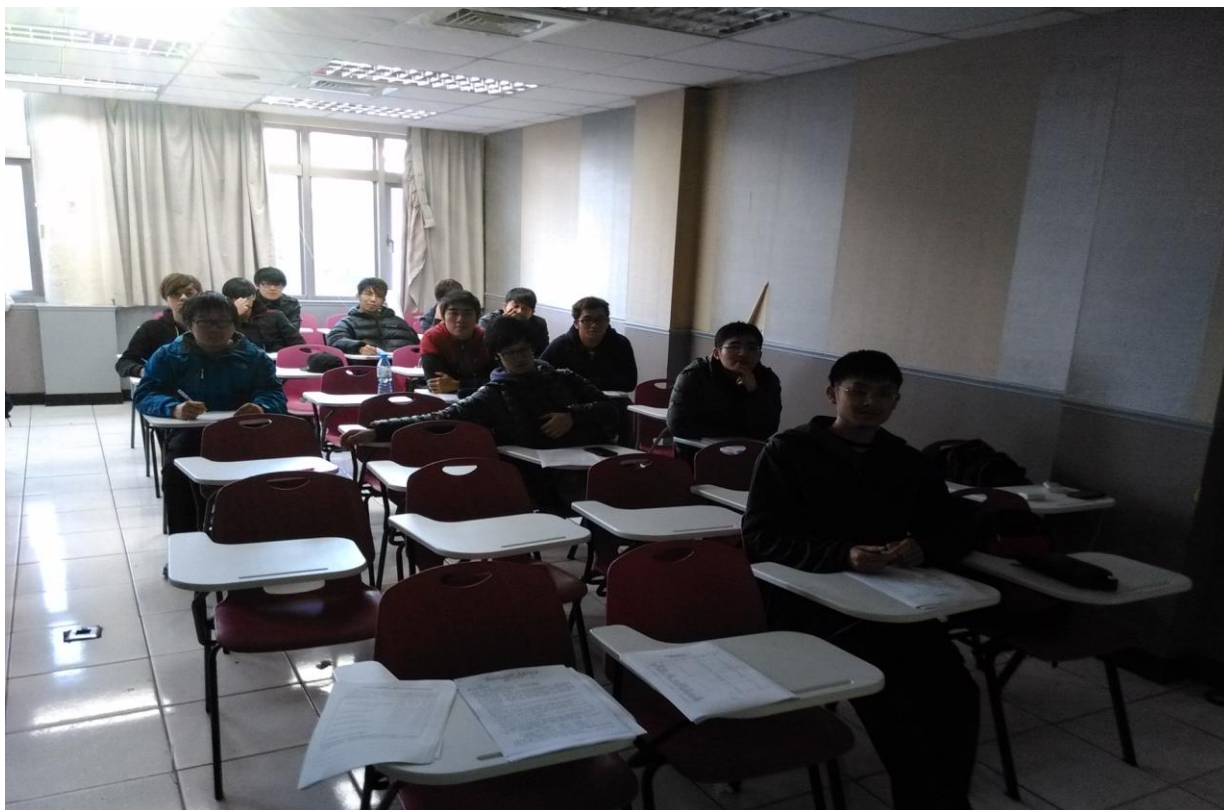
照片 3：同學們非常專注地聽講並勤作筆記