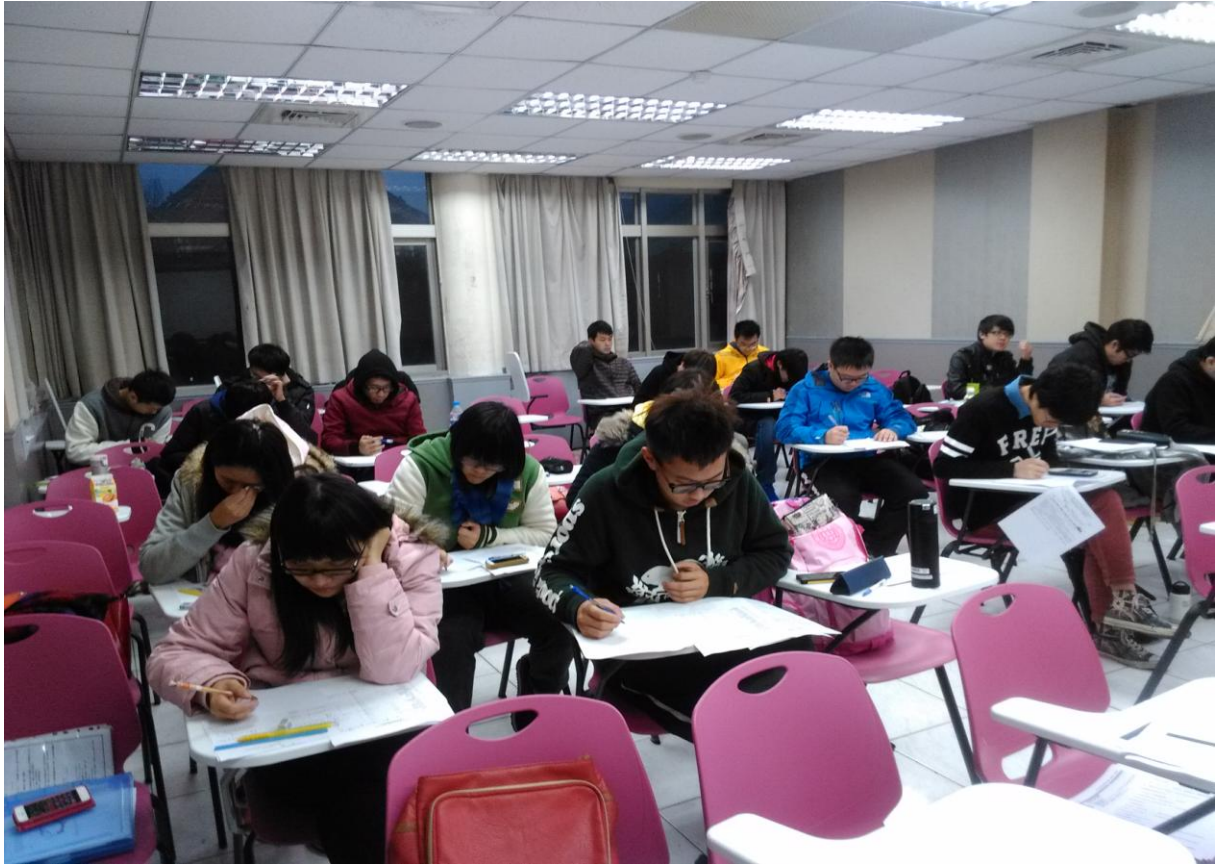
照片 5：同學們使用學習單模擬新金融商品的操作