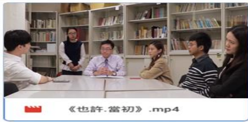
影片連結： 也許當初