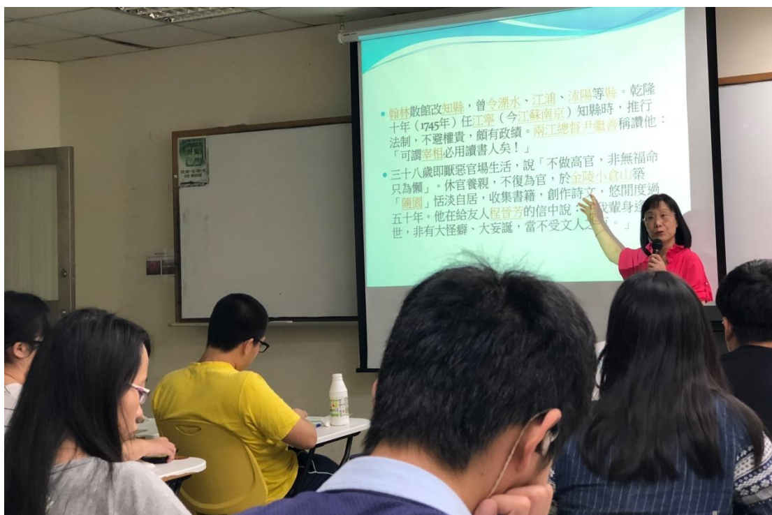
圖一：教師課堂講解