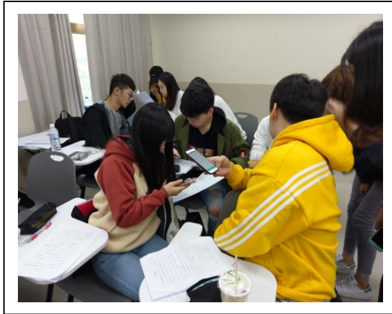
利用手機回答問題