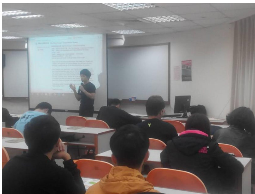
學生與全班分享個人聽力心得與策略運用