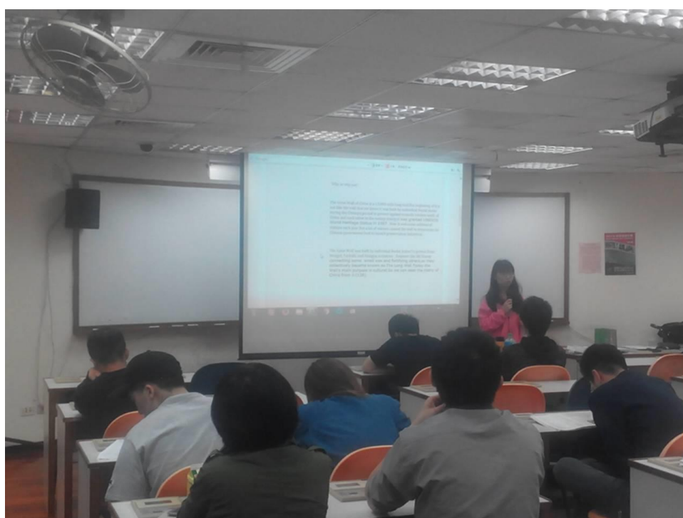
學生與全班分享個人聽力心得與策略運用