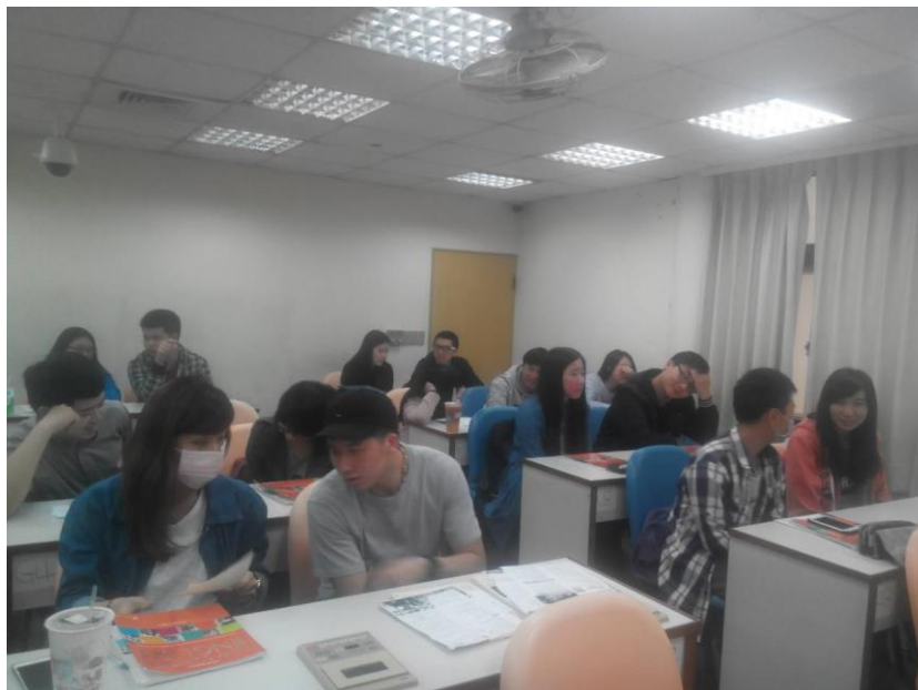
學生互相分享聽力心得與策略運用