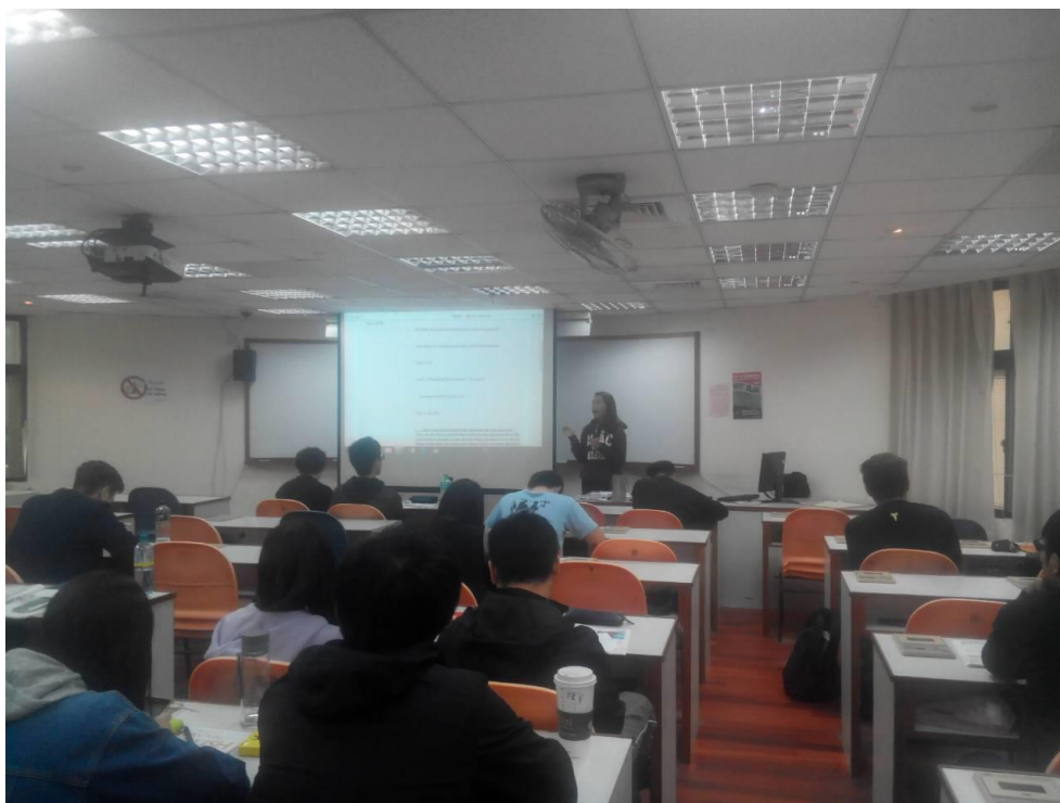
學生與全班分享個人聽力心得與策略運用