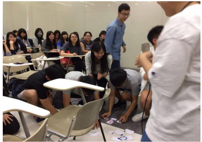
修課同學進行相關活動-8