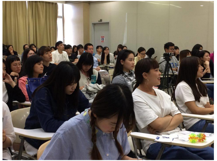
修課同學進行相關活動-6