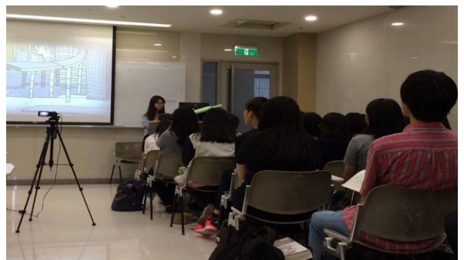
修課同學進行相關活動-10