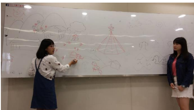
修課同學進行相關活動-9