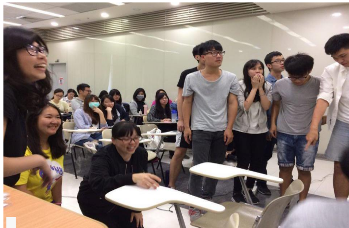
修課同學進行相關活動-4