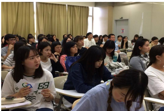
修課同學進行相關活動-3