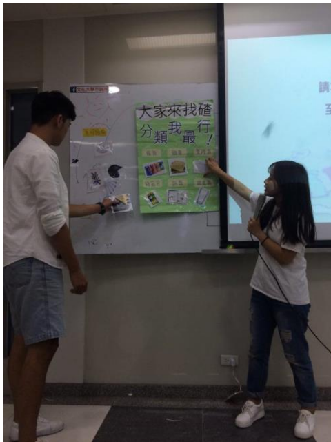
修課同學進行相關活動-1