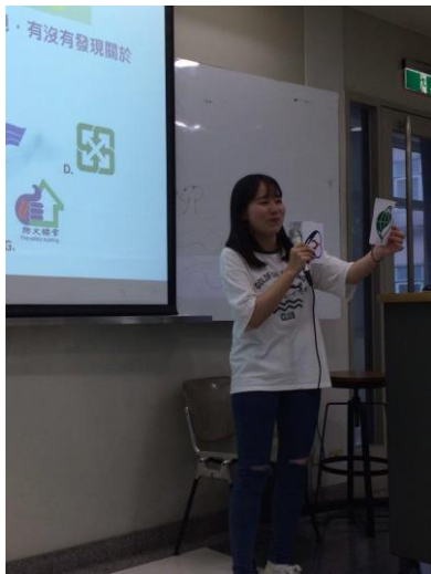
修課同學進行相關活動-5