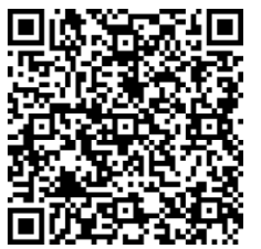
▲11302 經濟不利學生安心就學獎補助（選修項目）線上申請