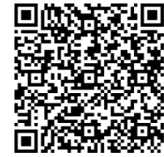
▲11302 經濟不利學生安心就學獎補助（必選項目四）線上申請