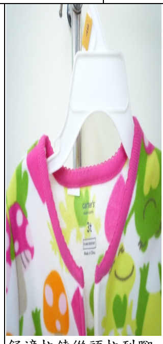
舒適拉鍊從頭拉到腳

打樣時有青蛙鞋襪造型，出貨上架時並無青蛙鞋襪造型。因為報價—青蛙造型鞋底—做工較為複雜一點且用布採購成本增加—報價比較貴些。最後報價與樣品必須符合客人 target price