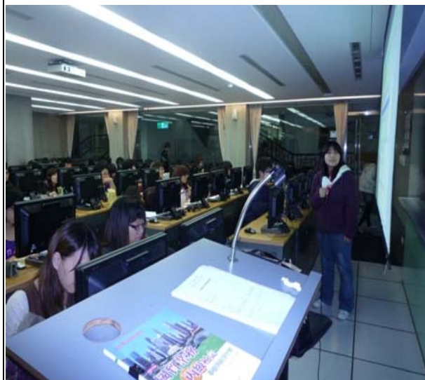
同儕經驗分享與傳承。