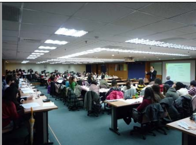
全場同學上課剪影(二)