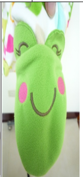
可愛青蛙鞋套造型