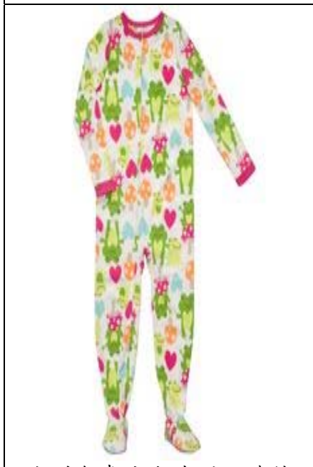
腳部並無青蛙造型-此乃連鎖店正品(出大貨商品)