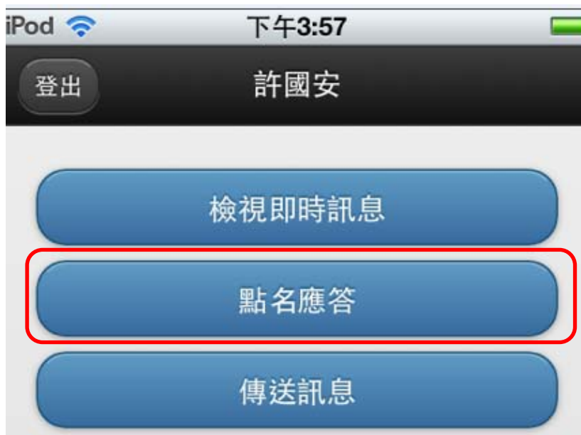
畫面一：學生點名畫面