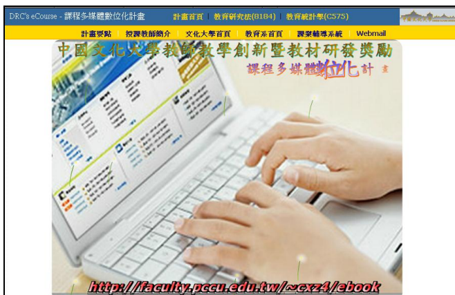
利用「課業輔導管理系統」統計學生課後複習或補課之使用次數