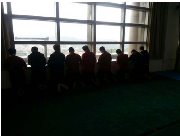
修課學生默寫經典狀況