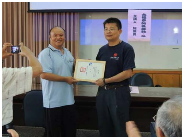
宜蘭社區大學講習狀況