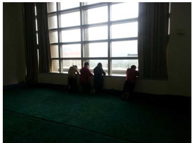
修課學生默寫經典狀況