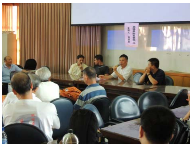
宜蘭社區大學講習狀況