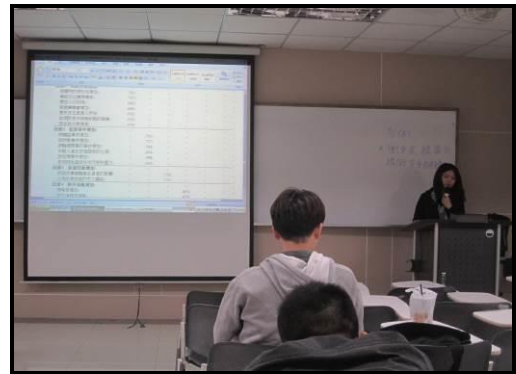
(觀光衝擊與管理課堂簡報實況)