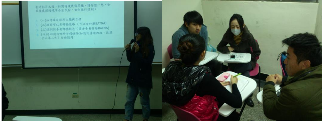
各組結論分享及分組討論