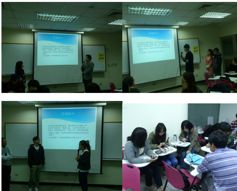
各組結論分享及分組討論