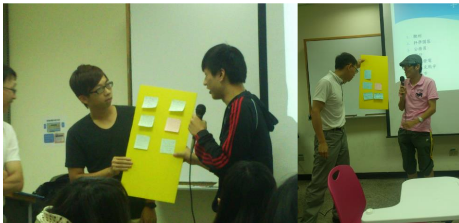
各組便利貼討論版：